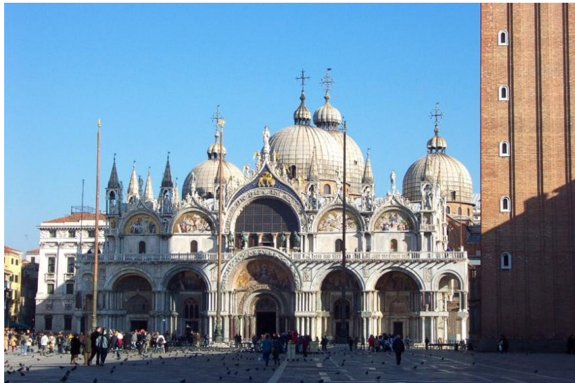
كلئيساي سان ماركو له فينيسيا.

له ناوهوي كلئيسا گه وره رۆمانيه كه دا، گه شتياره كان له ناو تاريكي دا ناخرا بوون. تاق له دواى تاق كرايه وه و بهرچاو ديار نه بوو. گري چهند مۆميک تيره ترييان ده كرد. فريشتهيه كى بى روه خسار له باوهشى نام و به هه موو جهسته يه وه چرياندى: "شهرم مه كه له بهر ئه وهى كه مرؤفيت، سه ربه رز به !